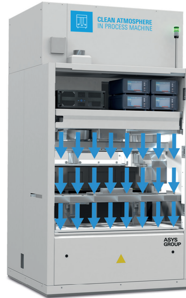
Laminarer oder turbulenter Luftstrom für Reinraumklassen bis ISO 5

Von Inbetriebnahme über Wartung und After Sales Service bis hin zur Qualifizierung – bieten wir Ihnen alles aus einer Hand.