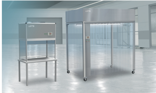
Reiner Arbeitsplatz & mobile Reinraumkabine zur Fertigung hochsensibler Bauteile