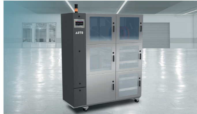
Aufteilung des gesamten Trockenlagersystems in drei autarke Kammern möglich