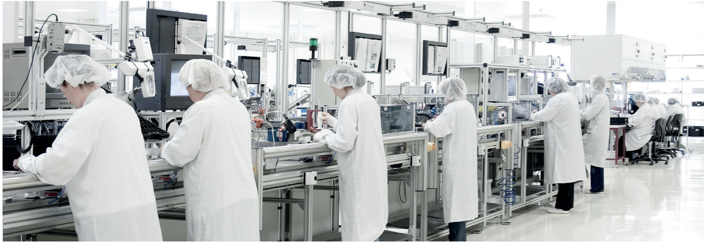
Reinraumlösungen gemäß VDI, ISO, GMP und Sauberräume gemäß VDA 19