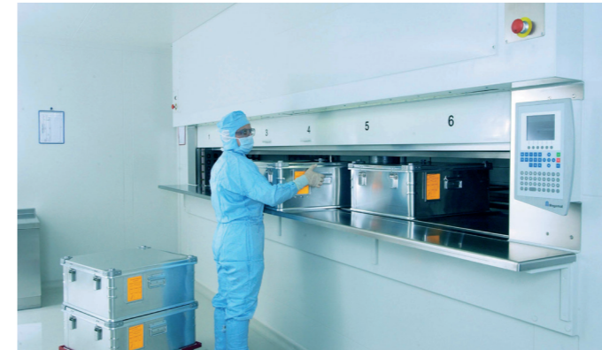
Das Lagerliftsystem ist über mehrere Stockwerke umsetzbar