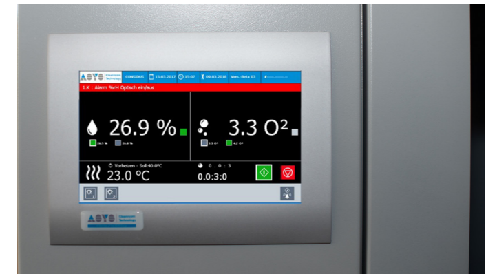
Induktive und bedienerfreundliche Steuerung mit umfangreichen Features

Erweitern Sie Ihr Trockenlagerschrank mit einer Vielzahl an Optionen, angepasst auf Ihre Bedürfnisse.