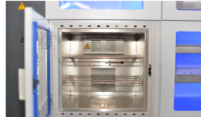
Temperofen mit automatischer Verriegelung, einstellbar 125°-140°C

Wir beraten Sie gerne zum richtigen Trocknungsverfahren – abgestimmt auf Ihre Anforderungen.