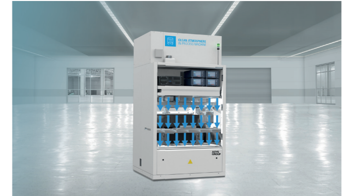
Das Klimamodul schafft kontrollierte Umgebungsbedingung innerhalb einer Prozessmaschine