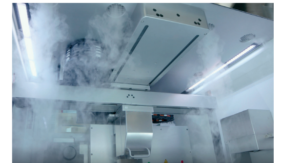
Kontrollierbare Mikroumgebungen in der Prozesskammer

Ob trocken, klimatisiert, rein oder eine Kombination hieraus – unser Klimamodul passt sich jeder Anforderung flexibel an.